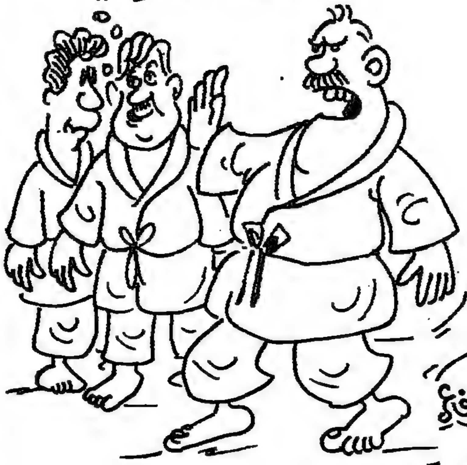
فتح وردح وستائم هتة قبة البرلمان!!